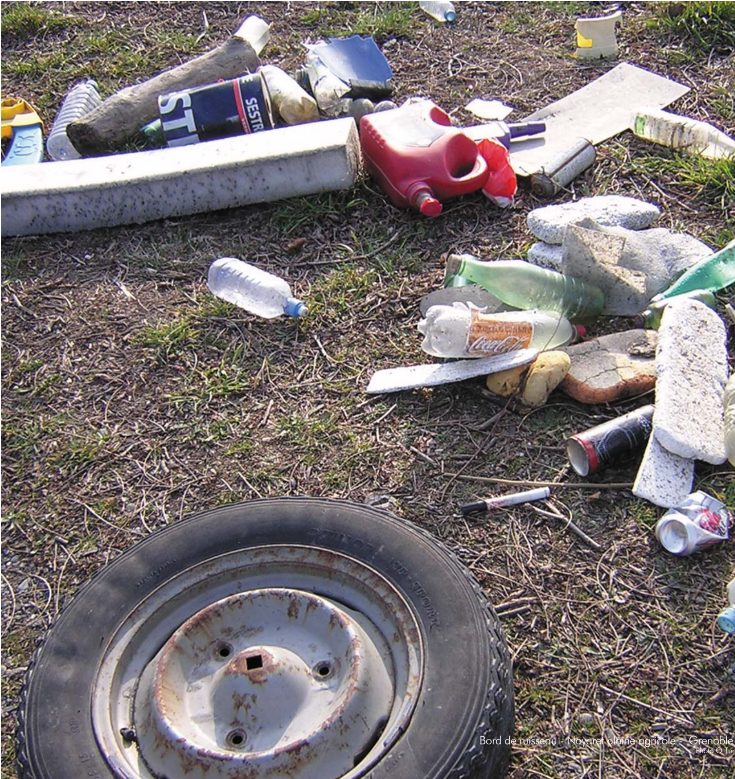
Bord de ruisseau - Noyère plaine agricole - Grenoble