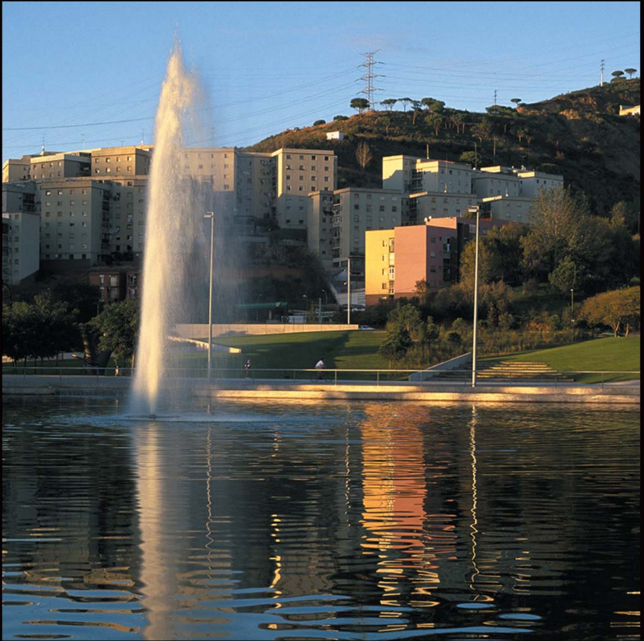
Llac i brollador Can Zam - Barcelona