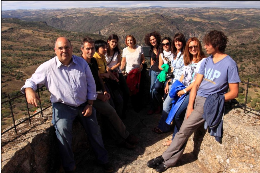
Algunos de los componentes del grupo de trabajo durante el seminario celebrado en el Parque Natural de Arribes de Duero.

con colectivos sociales cuya relación directa con dichos espacios suponga una mejora en su calidad de vida. Gracias a este proyecto se abren nuevas oportunidades para establecer sinergias y alianzas muy positivas.