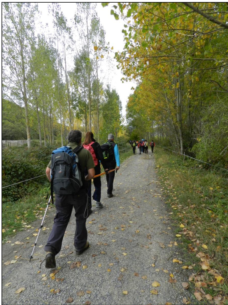
Recorrido con barra direccional en el Parque Natural Fuentes Carrionas, Fuente Cobre y Montaña Palentina