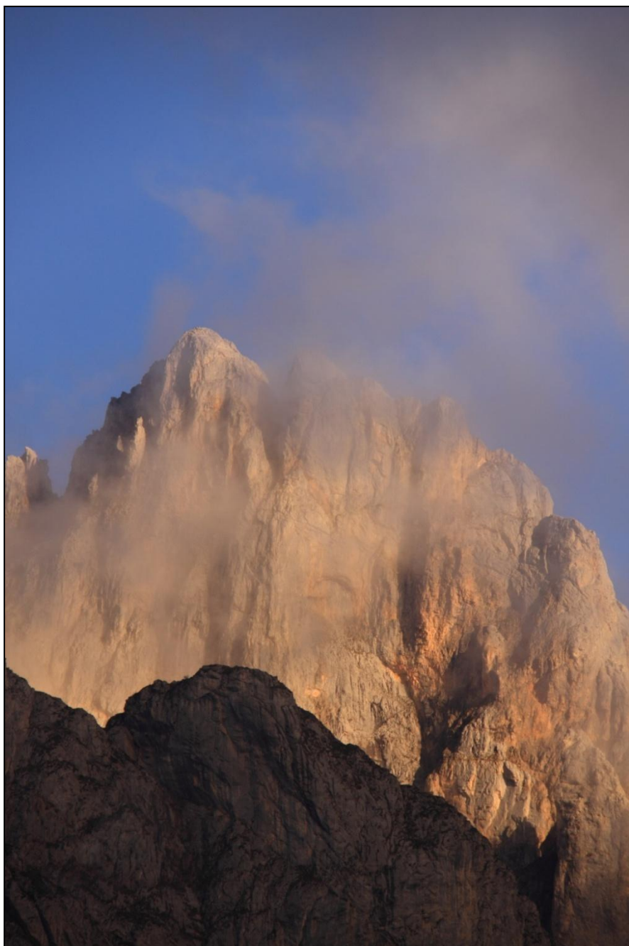
Espectaculares paisajes en el Parque Nacional de los Picos de Europa. Vertiente leonesa.