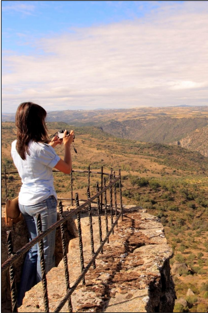
Las vistas del territorio del Parque Natural Arribes de Duero desde el alto de Fermoselle animan a la práctica de la fotografía de paisajes.