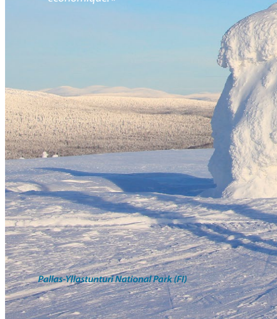
Pallas-Yllastunturi National Park (FI)

« Le tourisme durable dans les espaces protégés européens apporte une expérience enrichissante, préserve les valeurs naturelles et culturelles, soutient les moyens de subsistance locaux, la qualité de vie et est viable au plan économique. »