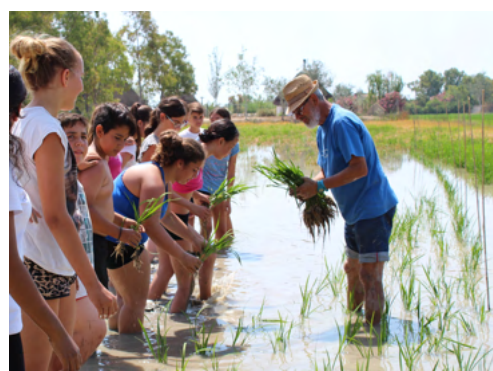
Ganadores de los Premios STAR 2019: