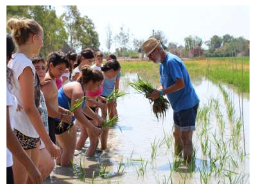
Winners of the 2019 STAR Awards, top to bottom: